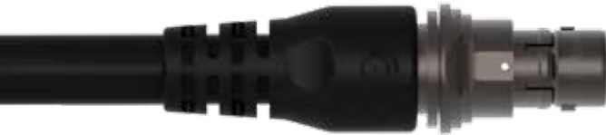
11 (8, 12, 16, 19 極)