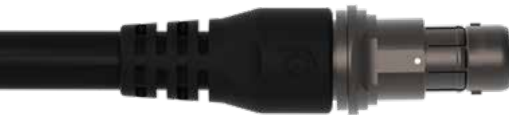
13 (2+3, 3+3, 27 極)