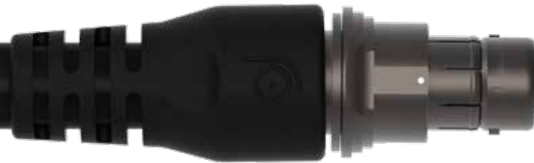
18 (42 極)